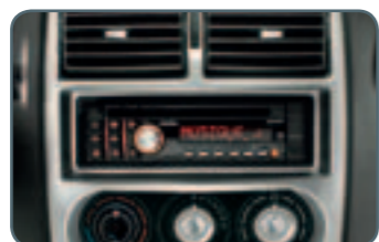
RDS-Radio/CD, MP3, Lautsprecher und zusätzlicher Steckplatz