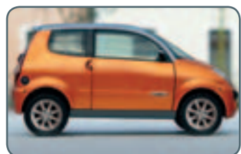
14" Leichtmetallfelgen Bereifung: 155/65/R14