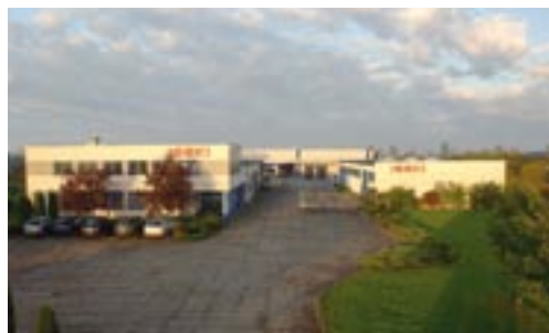
ISEKI-Niederlassung in Naunhof bei Leipzig