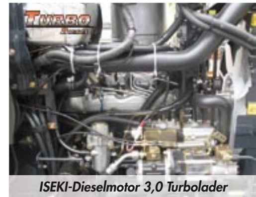
ISEKI-Dieselmotor 3,0 Turbolader

Seit Jahrzehnten entwickelt und produziert ISEKI Dieselmotoren. Der 4-Zylinder-ISEKI-Dieselmotor zeichnet sich durch enormen Drehmoment und beeindruckende Laufruhe aus. Selbst unter schwierigen Einsatzbedingungen bietet er aufgrund des hohen Drehmomentanstiegs noch ausreichende Kraftreserven.