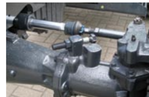
Robuste Achse mit hoher Nutzlast