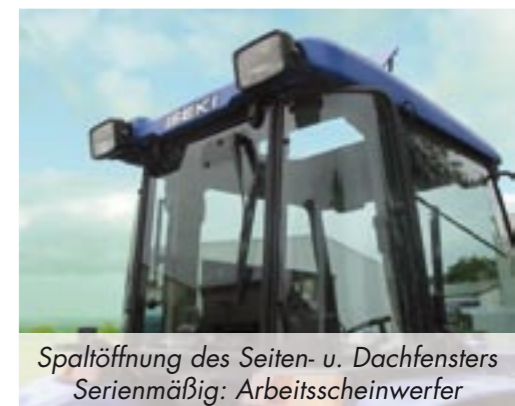
Spaltöffnung des Seiten- u. Dachfensters Serienmäßig: Arbeitsscheinwerfer