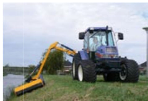
Mäheinsatz mit Heckauslegemäher