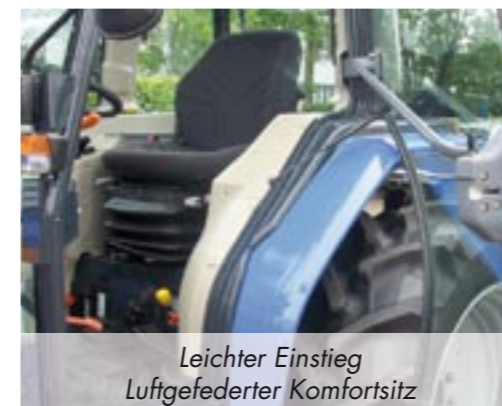
Leichter Einstieg Luftfederter Komfortsitz