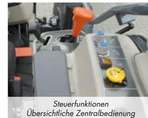
Steuerfunktionen Übersichtliche Zentralbedienung