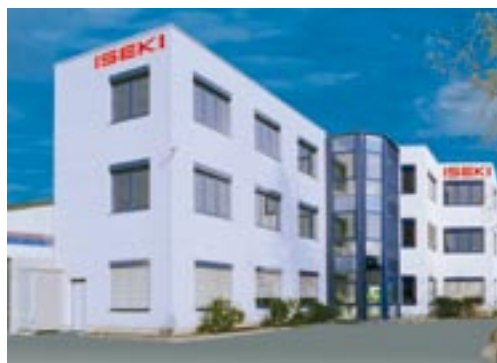
ISEKI-Hauptsitz in Meerbusch bei Düsseldorf

Über 40 Jahre ISEKI-Deutschland stehen für eine konsequente, außerordentlich erfolgreiche Entwicklung Anwender orientierter Technik. Mit dem kompletten Know-how technischer Lösungen für die Grundstücks- und Landschaftspflege bieten wir Ihnen ein auf Ihre Anforderungen abgestimmtes Produktspektrum mit System. Darin sehen wir unseren Auftrag!